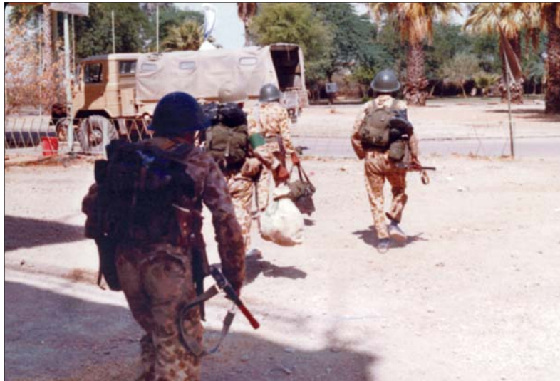
گروهی از نیروهای بسیجی مسلح و با تجهیزات در حال اعزام به منطقه عملیات طریق القدس.

کردند که چند هدف را دنبال می‌کرد: کاستن از خطوط پدافندی و در نتیجه آزادسازی نیروها به منظور افزایش توان برای آزادسازی گام به گام سایر مناطق اشغالی و آماده شدن برای عملیات بعدی تا انهدام ماشین جنگی ارتش دشمن.