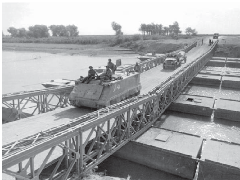
عبور یک دستگاه نفربر و یک دستگاه خودرو حامل تانکر آب از روی پل نصب شده بر روی رودخانه کرخه؛ منطقه عملیاتی طریق القدس؛ ۱۳۶۰/۰۹/۱۰