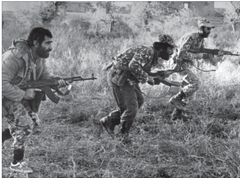
سه نیروی رزمنده بسیجی، مسلح و در حال جنگ و گریز؛ حومه شهر بستان؛ ۱۳۶۰/۰۹/۰۸

حضار) برادر عزیزمان رشید مسئول عملیات سپاه، در این جریان، دستور آغاز عملیات را می‌دهد، به امید آنکه انشاء الله بتوانیم تا چند ساعت آینده به مرز برسیم" (انشاءالله حضار) (۱۶) غلامعلی رشید فرمانده عملیات و قرارگاه کربلا نیز این گونه کلام را آغاز و رمز را اعلام کرد: بسم الله الرحمن الرحيم "ولاحول ولاقوه الا بالله العلی العظیم" بنا به دستور فرماندهی کل سپاه پاسداران انقلاب اسلامی و با کسب اجازه از ایشان، من به عنوان فرمانده عملیات، کلمه رمز شروع عملیات اخیر را که به نام عملیات طریق القدس معروف است می‌دهم: "یا حسین!..." (۱۷)